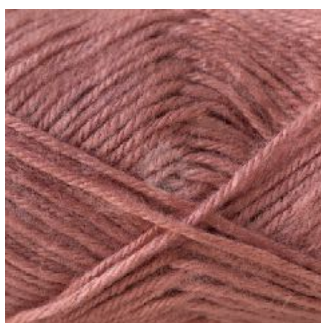
# ROSA VIEJO