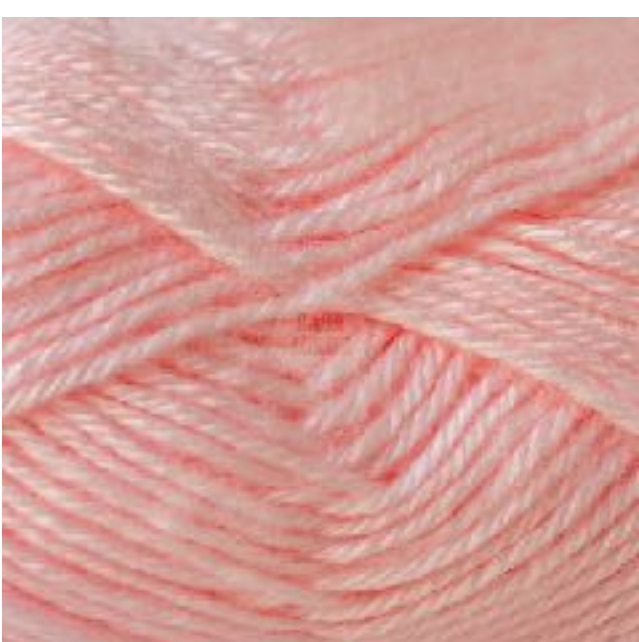
# ROSA BEBE