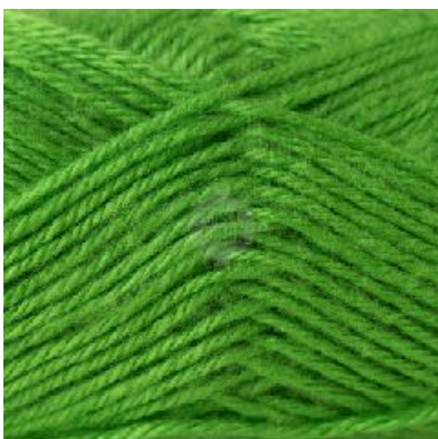
# VERDE MANZANA