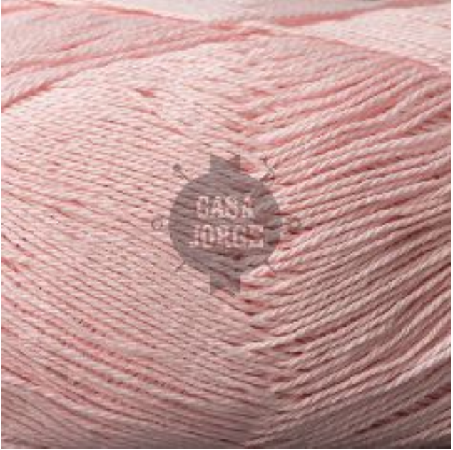
#03 ROSA BEBE