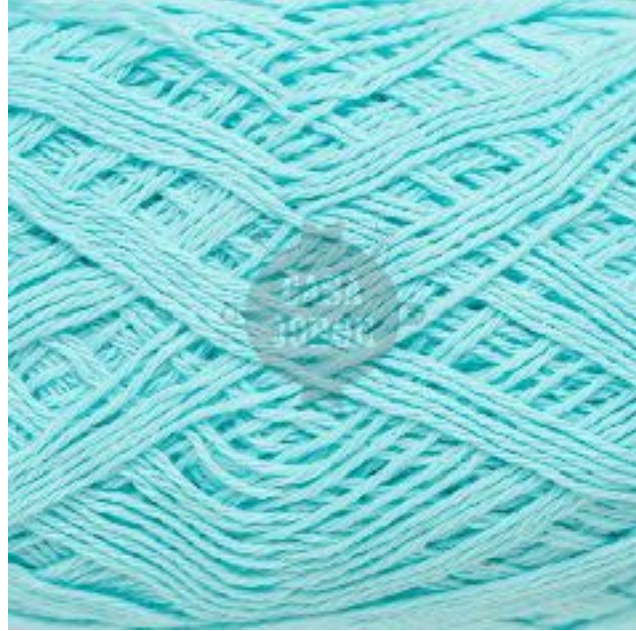
#07 VERDE AGUA BEBE