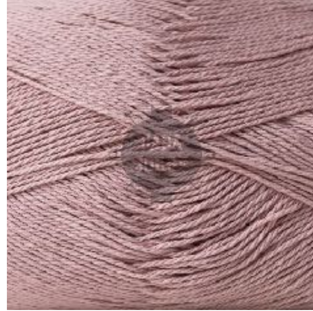
#10 ROSA VIEJO