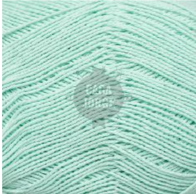
#07 VERDE AQUA

UNA TEXTURA CLÁSICA Y CÓMODA PARA LA PIEL QUE SIEMPRE LUCE CON ESTILO Y ESTA DE MODA. LO BUENO, COMO VICKY, ES PARA SIEMPRE. LA CARTA DE COLORES TE OFRECE LA POSIBILIDAD DE CREAR DISEÑOS PARA CUALQUIER ESTACION DEL AÑO. ADEMÁS SU CALIDAD RESISTE LA INTEMPERIE Y LOS LAVADOS, PERDURANDO SUS COLORES POR MUCHO MÁS TIEMPO.