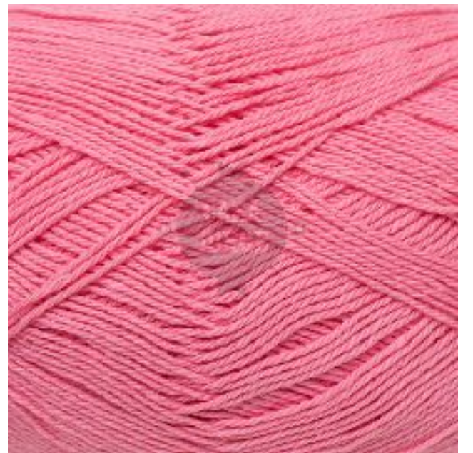
#14 ROSA DIOR